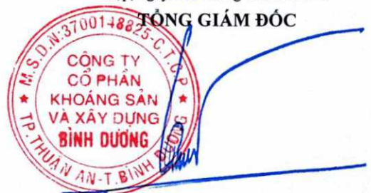
Lương Trọng Tín